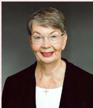
Landesbischöfin Kristina Kühnbaum-Schmidt Landesbischöfin der Evangelisch-Lutherischen Kirche in Norddeutschland und EKD-Schöpfungsbeauftragte